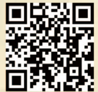
藝術節詳情 Details of Arts Festival

Dates and venues for each class are available on the official website www.hkypa.org